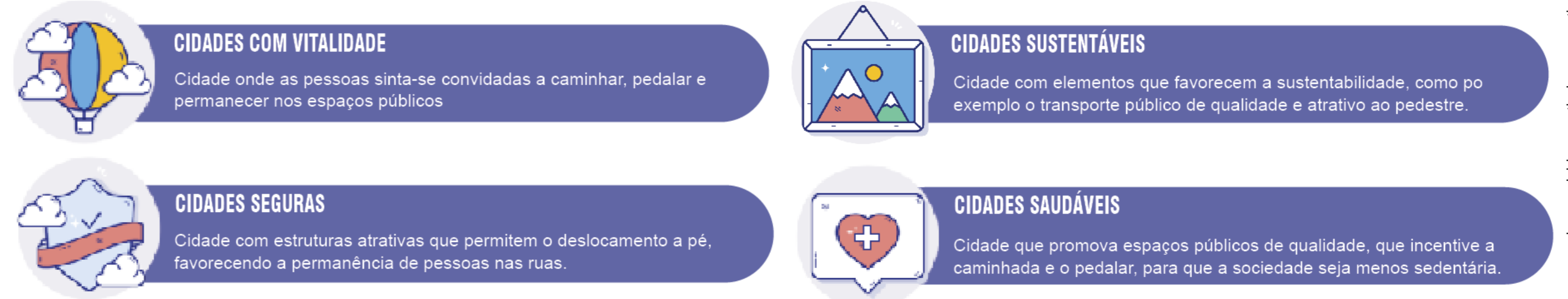
Figura 01. Pontos chaves de cidades para pedestres, segundo Jan Gehl.

Os conceitos abordados pelos autores, revelam a importância de promover espaços que favorecem o uso por pedestres, pois aumenta a vitalidade urbana e conseqüentemente valoriza os espaços públicos do centro.