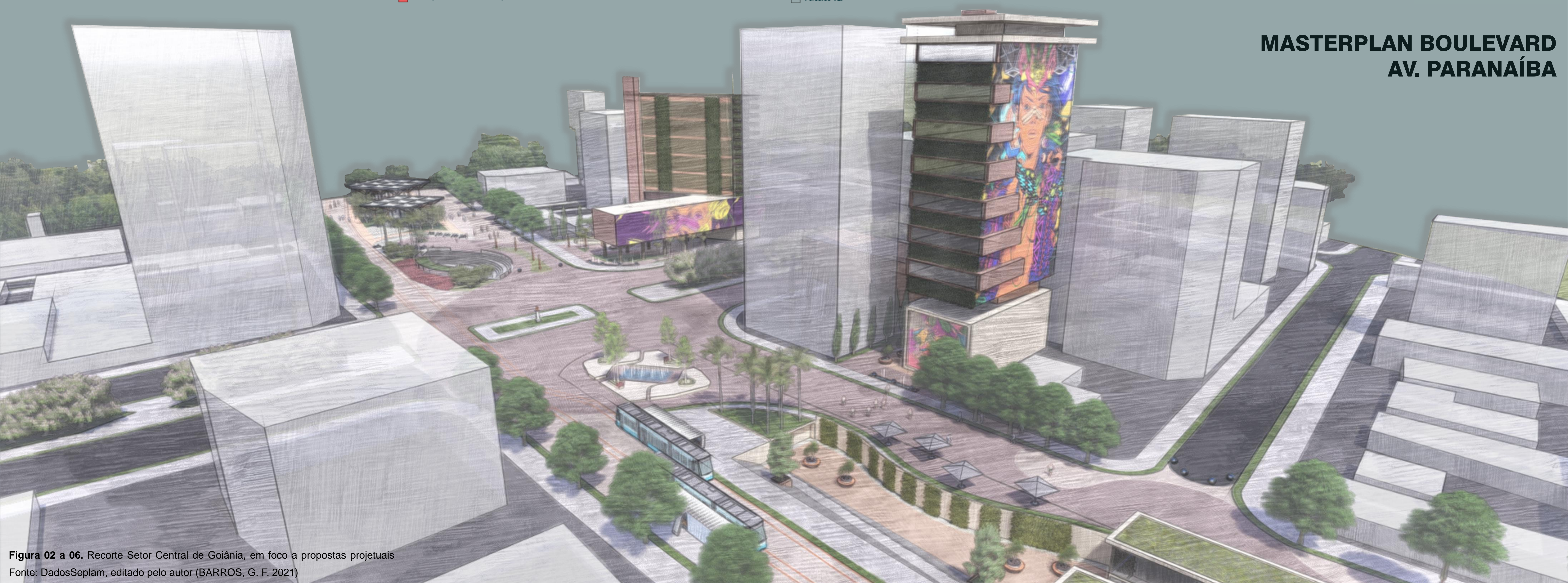
MASTERPLAN BOULEVARD AV. PARANAÍBA